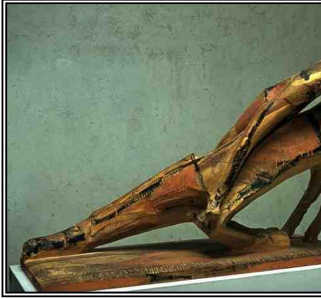
شكل رقم (2)

ومن التكوينات التي يتضح فيها قيمة الخط والمعالجات التشكيلية للتجريدية التعبيرية: والذي يقوم فيها الخط بدور إيجابي كعنصر من عناصر التشكيل النحتي العمل المسمي معجزة Miracolo " للفنان "مارينو ماريني "