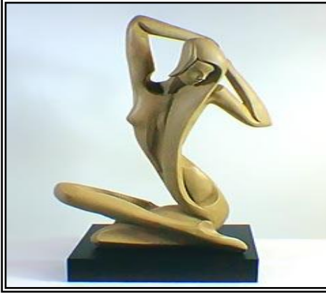
شكل رقم (3)

ومن التكوينات التي يتضح فيها قيمة السطح والمعالجات التشكيلية للتجريدية التعبيرية: التي تتضح فيها قيمة السطح تعبيرياً وتشكيلياً كعنصر تشكيلي وهو تمثال "الاستيقاظ Awaking Dawn's" عام 1973م للنحات "اليكسندر دانييل"