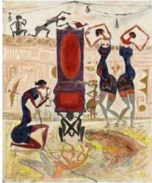
شكل (٤) المغني والبيانو (١٩٨٩)

كما نلاحظ في اللوحات تأثره بعنصر أساسي في الفن الأفريقي وهو أشخاص إفريقية محرفة، كما نجد حوار الأشخاص مع الطير يماثل حوار التماثيل مع الحيوانات والطيور، كما ترجم النقش على التماثيل إلى نقش على شخوصه المرسومة في اللوحة، ومن هنا يمكن لنا أن نلاحظ بشكل جلي السمات المشتركة بين الفن الأفريقي وبين أعمال الفنان حامد ندا كما في شكل (٤). (محمد، داليا، ٢٠٠٢. ص ١٤٢)