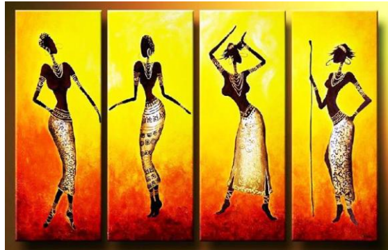
شكل (١) لوحة للفن الإفريقي بعنوان "سيمفونية نيجيرية"، للفنان بينديكت تشوكوكاديبيا (خطاب، أسماء،

“ قد صنع شعب شوا وهم عدد صغير من السكان على حدود شمال غرب من مملكة بوشونغ الكونغو لوحات رسمية مبهجة بصريا وملونة والتي تجمع بين التقليد والابتكار بطريقة فنية معقدة وعلى الرغم من الحفاظ على لغة مختلفة وعلاقات سياسية متراخية فإن شوا تشترك في العديد من العادات الثقافية مع شعوب مملكة بوشونغ" (ميوارنت، جورج، ١٩٨٦. ص ٥) كما في شكل (١، ٢).