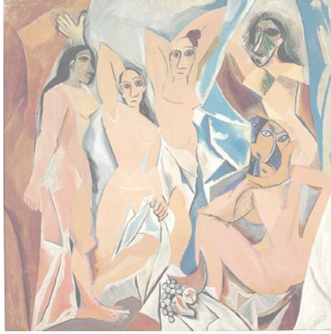
شكل (٣) بابلو بيكاسو - نساء عاريات - ٣٧٥×٣٨٧ سم