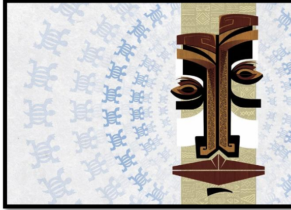
العمل الثاني (نقل حراري بالإستفادة من جماليات التدرج للإستنسل)