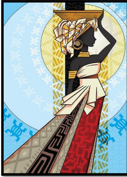
العمل الثالث (نقل حراري بالإستفادة من جماليات التدرج للإستنسل)