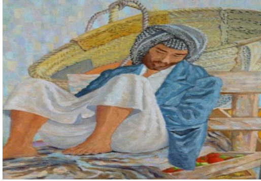
شكل رقم (١) الفنان التشكيلي حسين مسيب لوحته (الحمالي)