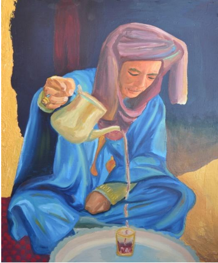
العمل رقم (٢) شكل رقم (١٢) شخص يحمل براد شاي خامه العمل : الوان زيت ، شاسية خشب ، طلاء ابيض ، قماش ابيض مساحه العمل : ٦٠*٧٠

المتناغم بين الشكل و الخلفية داخل عناصر العمل بماوقد استلهم العمل من العادات والتقاليد الشعبية التي استخدمها الفنانين التصويريين يحقق بذلك فرض البحث.