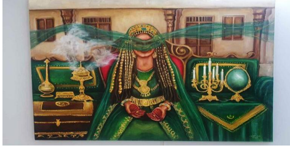
شكل رقم ( ٤ ) ابتسام العصفور الجلوه من مراسم الاعراس القديمة ٢٠٢٣م تشكيلية كويتية تحوّل العادات والتقاليد إلى لوحات فنية https://www.ajnet.me/arts/٢٠٢٣