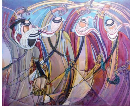
شكل رقم ( ١٠ ) الفنان التشكيلي الكويتي إبراهيم إسماعيل

وارتبطت أعمال الفنان ( إبراهيم إسماعيل ) بنمط الحياة في الكويت قديما وبالحنين الدائم إليها مما دفعه بشكل تلقائي منذ انطلاقة مسيرته الفنية في بداية السبعينيات من القرن الماضي. وخلال تلك المرحلة مزج الفنان بين تأثره العميق بالبيئة الكويتية وإحياء مفرداتها واقتناصها على سطح اللوحة وبين تطوره الدائم ومحاولة اكتشاف أساليب جديدة وابتكار أسلوب تعبيرى متميز خاص به، ونجح في تحقيق تلك التوليفة المتسمة بالبساطة وبناء تكوين لوحته من مساحات وتقسيمات ملونة تنتشر على سطح القماش وتترابط فيما بينها تحت خطوط هندسية متقاطعة.