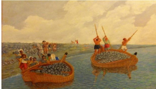
شكل (٢) الفنان التشكيلي الكويتي حسين مسيب - مقالع الصخور

الواقعية الاجتماعية في لوحات الفنان الكويتي حسين مسيب