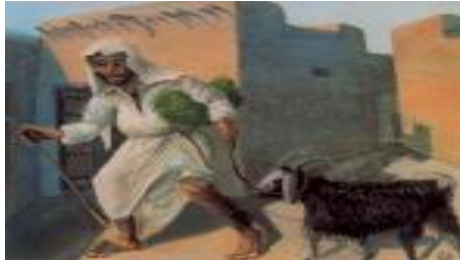
شكل رقم ( ٤ ) الفنان التشكيلي الكويتي ايوب حسين الايوب - المودّي

له مكانته لدى أهل الكويت، https://www.alanba.com.kw/ar/kuwait-news/