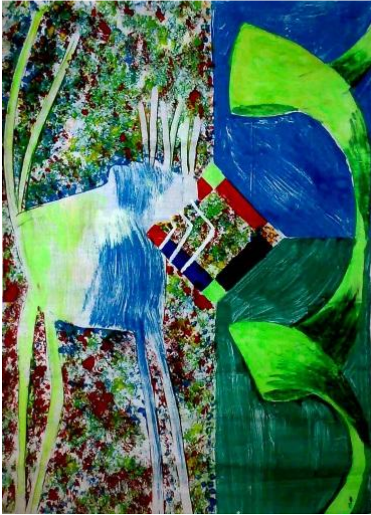
من أعمال الباحث (مينوتيب مستوحى من الفن الفطري بالطريقة الجمعية والطرحية) ، ٧٠×٥٠سم