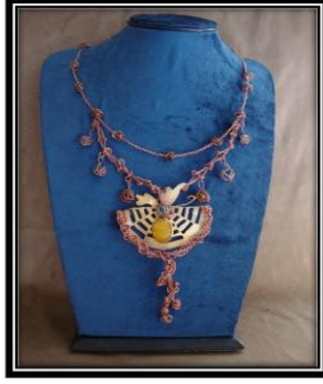
الشكل (٥) يوضح المشغولة المعدنية عبارة عن حلى معدني ( دلالية) سابقة التجهيز (زكي، شرين، ٢٠١٩، ص٤٥)