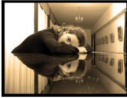
شكل ( ٢ )

٢- تكوين قائم على قانون الثلث Law of Thirds : وهو الصيغة التي قدمها "إقليدس" عن نموذج الجمال المثالي وهو أن النسبة بين الجزء الأكبر والأصغر يساوي النسبة بين الجزء الأكبر والكل، وهو ما يطلق عليه النسبة الذهبية أو القطاع الذهبي، ويعتبر هذا التكوين هو الأكثر قدرة على جذب الإنتباه وإثارة عين المتلقي ، ويوضح ذلك شكل رقم ( ٣ ) .