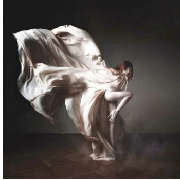
شكل (٣) (الفتي، محمد، ٢٠١٥. ص٦٥)

٢- تكوين قائم على قانون الثلث Law of Thirds : وهو الصيغة التي قدمها "إقليدس" عن نموذج الجمال المثالي وهو أن النسبة بين الجزء الأكبر والأصغر يساوي النسبة بين الجزء الأكبر والكل، وهو ما يطلق عليه النسبة الذهبية أو القطاع الذهبي، ويعتبر هذا التكوين هو الأكثر قدرة على جذب الإنتباه وإثارة عين المتلقي ، ويوضح ذلك شكل رقم ( ٣ ) .