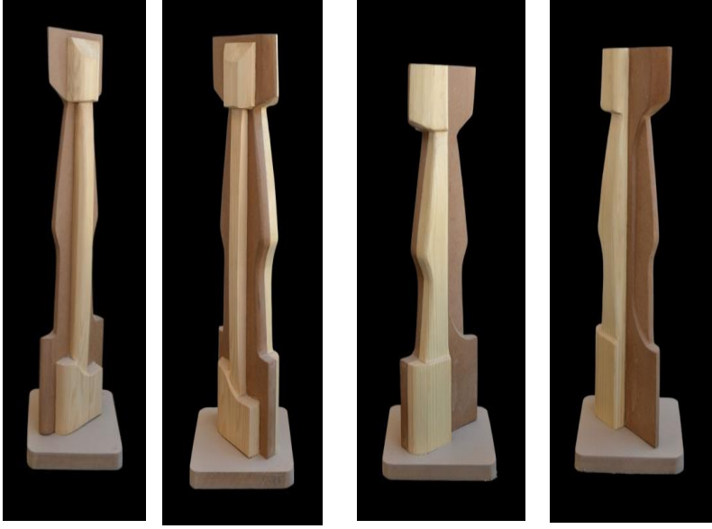
شكل رقم ( ٣ ) العمل رقم ( ١ )