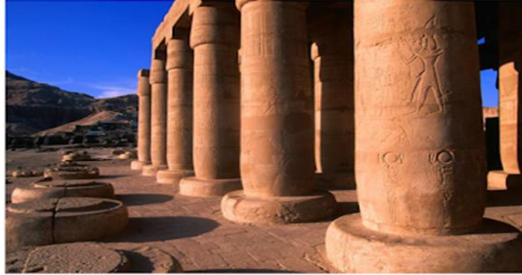
شكل رقم ( ٢ ) : الاعمدة البردية المنغلقة .