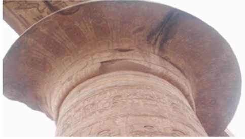
شكل رقم ( ١ ) : عمود من عصر الحضارة المصرية يتميز بتاج ناقوسي الشكل عبارة عن تاج عمود البردي المبرعم والبدن يتميز بزخارفه المتعددة .

وان العمود الحتحوري يتكون من بدن مستدير مزينا براس المعبودة حتحور وان بدن الاعمدة الحتحورية يمثل مقبض اله السستروم ، ويعتبر السستروم احد الرموز المقدسة للمعبودة حتحور وكان يستخدم حينما يؤدي طقوس العبادة لها ، واثاء الدولة الحديثة فقد وضع التاج الحتحوري ايضا فوق بعض الدعامات المربعة ، و هذا ما حدث في معبد حتحور الصغير في ابو سمبل او سراييط الخادم ، او يوضع علي اعمدة اسطوانية في الشرفة الوسطي بمعبد الدير البحري. ( تشرني، روسلاف ، ١٩٩٦م )