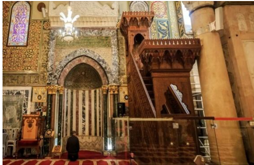
شكل رقم ( ١ ) منبر نور الدين بيت المقدس

ويتضح ذلك في استخدام الفنان المسلم لزخارف الطبق النجمي علي الجدران الاسلامية وخاصة المساجد .