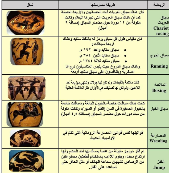
شكل رقم (١) أنواع الألعاب الاغريقية القديمة

موضحة أنواع الألعاب الاغريقية القديمة كما في شكل رقم (١) التالي