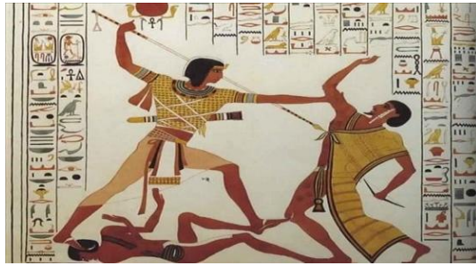
شكل رقم ( ١ ) الرماية في المصري القديم

واختلفت هذه الدراسة عن الدراسة الحاليه في "استحداث تشكيلات خشبية مجسمة من خلال صياغة المفردات المعمارية الإسلامية بالإفادة من برمجيات الكمبيوتر كما ان الدراسة الحاليه في مجال الفن التجريدي بينما هذه الدراسة في اشغال الفنيه . ومن الالعاب الرياضية في المصري القديم الرماية والتي اعتبروها قديماً رياضة الملوك قال الخبير الأثري عنها إن المصريون القدماء اعتنوا بها كثيراً كتدريب للدفاع عن الوطن ضد الغزاة والمجرمين، وأصبحت هذه الرياضة من الرياضات التي أول من مارسها ملوك مصر القديمة، وظهرت على جدران معبد "سيتي الاول بأبيدوس"، وأيضاً هناك صور تضم مجموعة من الرماة يتدربون على رياضة الرماية عن طريق استخدام القوس والسهم.