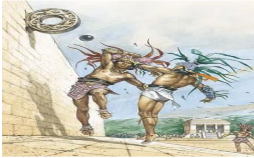
شكل رقم ( ٢ ) لعبة الكرة عند قبائل المايا

وفي القرون الوسطى تحول الجهد المعماري في بناء الكنائس بدلا من أماكن الترفيه والتسلية، وفي عصر النهضة لم يتم بناء صروح معمارية رياضية دائمة على الرغم من الاهتمام بالكلاسيكية والهندسة المعمارية للملاعب ومدرجات في نهاية القرن التاسع عشر انعكس تطور العلاقات الاقتصادية والثقافية بين الدول على تطور الرياضة فتأسس أول اتحاد رياضي دولي وتتنوع المسابقات فأقيمت دورات الألعاب الأولمبية الشتوية والأفريقية والآسيوية والعربية فأنشأت من أجل هذه المسابقات تجمعات رياضية خاصة تحتوي على أبنية متعددة تحتوي على أماكن لأقامه الوفود الرياضية ومراكز إعلامية، وعكست هذه التجمعات التطور التقني الحاصل في عالم الهندسة.