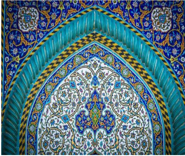
شكل رقم (١) زخارف بالنباتات

حيث تحمل الفنون الإسلامية في طياتها معطيات كبيره استغلها الفنان الإسلامي وأخرجها في صور فنية بديعة ونجده أيضا أتقن استخدام الطرز التشكيلية من الزخارف حيث تنتوع العناصر الزخرفية على الأقمشة المطبوعة ما بين العناصر الهندسة والنباتيه ، وتعد عناصر الفن الإسلامي مثل (الزخارف النباتيه شكل (١) - الزخارف الهندسية شكل (٢) - القباب - المقرنصات - الأطباق النجمية شكل رقم (٣) - الزخارف الكتابية.....) ثروة حضارية لا بد من دراستها وتحليلها و ابراز القيم التشكيلية والجمالية بها من خلال تصميمات مبتكره لتطبيقها على أقمشة التأنيث والمعلقات حيث ان السوق المصرية والعربية لا زالت تندر بها التصميمات التي تحمل الطابع الإسلامي .