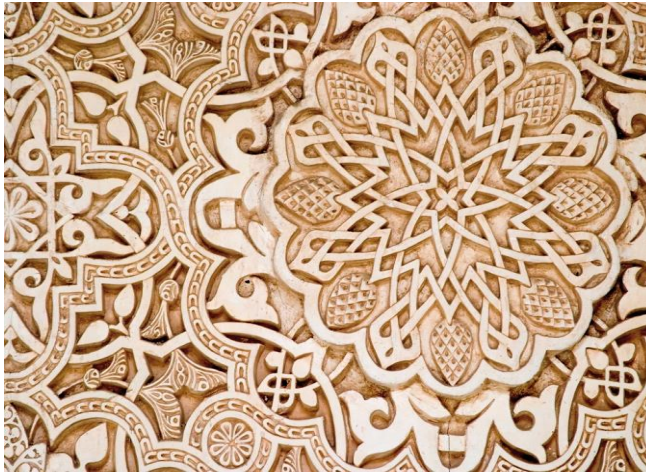
شكل رقم (٥) نماذج من زخارف الاربيسك النباتية

(Answer Of Securitization is a ornament that distinguishes) this craft