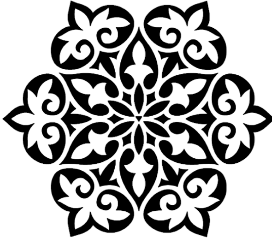
شكل رقم (٣) زخارف نباتية نجمية اسلامية ( https://www.almrsal.com/post/1233356 )

وبالرغم من عراقة فن النحت فى تلك البلاد التي فتحها الإسلام ، فإننا نجد أن استمرارية الاهتمام به لم تكن متوافقة مع ازدهار باقى الفنون الأخرى، وذلك لما صاحب عملية التجسيد أو المحاكاة لكل ما هو طبيعى من الخوف إلى العودة لعبادة الأوثان، ولكن نجد أن النحت الجداري ظل باقيا منذ العصور الأولى للإسلام ولكن بشئ من القلة والتحفظ عليه فيما يرتبط بأماكن العبادة .