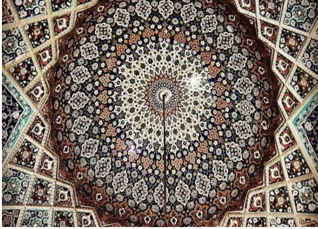
شكل رقم (٤) الزخارف الاسلامية بالتوريق

(Answer Of Securitization is a ornament that distinguishes) this craft