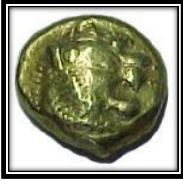
صورة رقم (3)