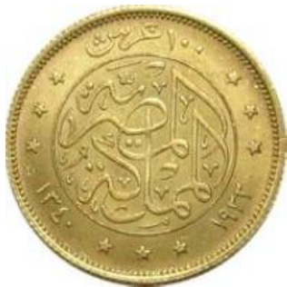
صورة رقم (8)