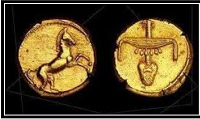
صورة رقم (6) ( http://www.coins4arab.Com )

عملة "جستيان الاول" من الذهب المصري 359_343 ق. م