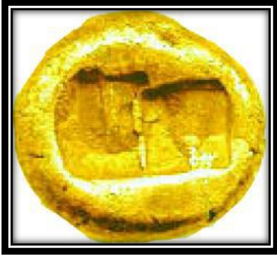
صورة رقم (5)

صورة رقم (2) ورقم (3) عملة ليديا في عهد الملك "أرديس" "Ardys" ق.م. 615-652