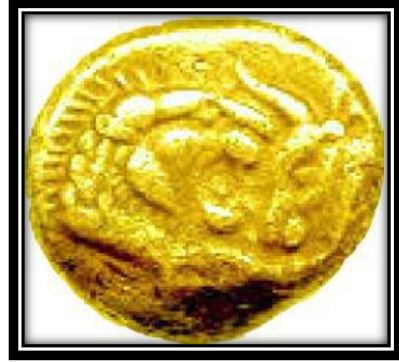
صورة رقم (4)

صورة رقم (4) ورقم (5) عملة في عهد الياتس "Alyattres" 561-610 ق.م. من الذهب.