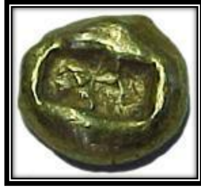
صورة رقم (2)

صورة رقم (2) ورقم (3) عملة ليديا في عهد الملك "أرديس" "Ardys" ق.م. 615-652 من الانترنت، ( http://worldcoincatalog.com )