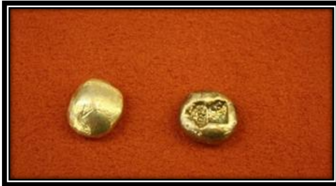
صورة رقم (1) (رمضان، 2016)

"ويتفق علماء التاريخ والنميات على ان مملكة ليديا القديمة (بالقرب من ازمير في تركيا حالياً) قد شهدت صناعة المسكوكات وانتشارها الى بلدان العالم اجمع، وذلك في القرن السابع قبل الميلاد، وكانت النقود تضرب من الهب الخفيف المسمى إيلكتروم، وهو خليط طبيعي من الذهب والفضة، بالإضافة الى استخدام الفضة والنحاس والبرونز أيضاً وكانت قطعة النقود على شكل حبة الفاصوليا" (رمضان، 2016) صورة رقم (1)