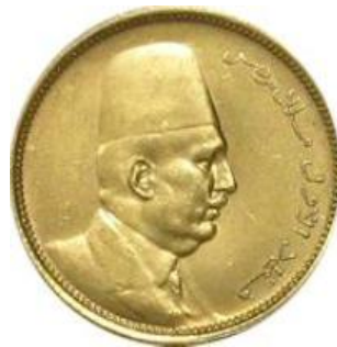
صورة رقم (7)

صورة رقم (7) ورقم (8) عملة ذهبية عيار 8750 فئة 100 قرش تزن 8,5000 جرام سكت عام 1340 هـ و1922م وتم السك بلندن للملك فؤاد (عبد الحكيم، 2011).