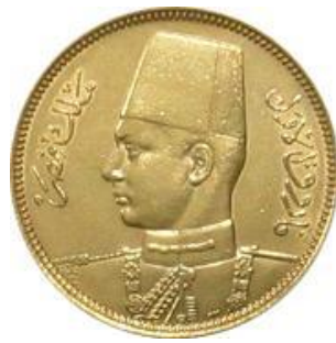
صورة رقم (9)

صورة رقم (9) وصورة (10) عملة ذهبية عيار 8750 فئة الجنية وزن 8,5000 جم، سكت عام 1357 هـ 1938 م، لندن للملك فاروق (احمد،)