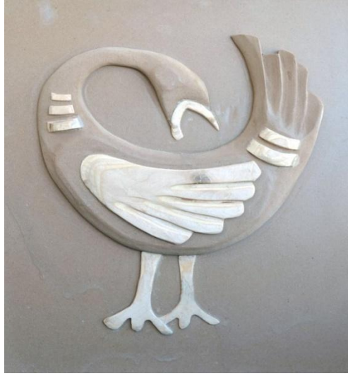
التطبيق رقم (١) الخامة : خشب × موسكى خشب معالج ٦٠ × ٤٥ سم من اعمال التجربة الذاتية للباحث

يطرح التكوين التجريدى نظرة شمولية للطائر تتضح ملامحه مع اقتراب هيئة الكتلة فى وصفها لهيئة الطائر ، ويبدو ذلك موحيا بقوة فى الأجزاء التى تشير الى الرأس والجسم والذيل ، ويأتى الإحساس بكيان الجناحين من خلال الخط المنحنى بوسط كتلة الجسم اللين ، ويمتد الخط ليشكل خروج الذيل وإمتداده ليعلو فوق كتلة الرأس ويتجه بالعين نحو الأفق . وقد عمد الباحث إبراز ملامح وسمات الطائر من خلال معالجة تشكيلية تجريدية إستخدم فيها السطوح المقعرة التى تحددها خطوط لينة إنسيابية ، فالخطوط المحددة لهيئة التكوين تمتاز بالليونة والاسترسال بما ترتب عليه من سلاسة الانتقال بين السطوح فى هدوء ، و نلاحظ فى التكوين إيقاع الكتل وتوزيعها فى نسق جمالى متوازن ، وقد حاول الباحث تحقيق نظرة شمولية تجمع بين مفردات العمل فى إيقاع متوحد يتناسب مع ضخامة العناصر وبساطة وجمال الاستدارة داخل الشكل والتى يؤكددها إحساس الظل والضوء المتناغم مع اتجاهات السطوح التى تتمتع بالصلق الجيد، كما عمد إلى إرتكاز التكوين على نقطة واحدة لما لهذا من تأثير قوى فى الإحساس بالحركة داخل أجزاء التمثال واتزانه فى الفراغ وخاصة مع الخطوط اللينة للتكوين وعلاقة كتلته مع الفراغ الخارجى الذى أكده اللون وسمح لإيقاع الظل والنور من تأكيد الشكل والمضمون .