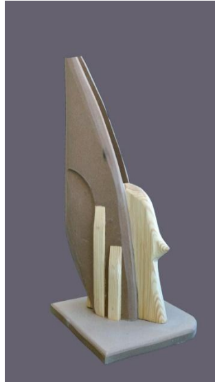
العمل رقم (٣) الخامة : خشب موسكي - خشب معالج الحجم: ٤٥×٢٣×٢٠سم من اعمال التجربة الذاتية للباحث

التكوين تعبير عن الحرية وتسجيل لمرونة وتألق الطائر بمعالجة تجريدية متعمدة ، فالرأس منفتحة الى أعلى اليمين في تطلع للحرية والتخليق ، والجناحين مرتفعين رأسياً في حركة تأهب وإستعداد للطيران ، وقد حاول الباحث تحقيق بعض القيم الجماليه للتكوين بإستخدام التجريد والتبسيط بما يتضمنه ذلك من إختزال لبعض التفاصيل وإظهار بعضها ، وقد عمد إلى التناوب في حركه السطوح ما بين مقعر ومحدب ومنحنى للتدليل وإظهار قيمة الحركة ومضمون الإنسيابه ، وعاونه على ذلك تلك الخطوط المنحنية واللينة التي أكسبت التكوين المرونة ومضمون الإستعداد للتخليق بحيويه ، وقد نوع الباحث في تشكيل السطوح دون انفصال في الرؤيه ، فالتكوين يتألف من مجموعة من الكتل بإتجاهات مختلفة ، وكان لتعمد المبالغة في حجم كتلة الذيل نسبة لكتلتى الجسم والرأس وإتجاههما تأكيد على قيمة الإئتران ، كما أن التباين بين كل من الخطوط الرأسية المتمثلة في الجناحين والخطوط الأفقية المتمثلة في الرأس والجسم والذيل أعطى للعمل قيمةً تشكيلية ، ويتضح ذلك في حالة الاتزان التي عليها العمل ، وقد ساهم كل من الخط وملمس التكوين الناعم وسقوط الضوء عليه في تحديد المسطحات والكتل والفراغات الموجودة في التكوين سواء كان ذلك الفراغ الكائن بين الجناحين أو الفراغ الخارجى للعمل ككل بما أكد على وحدة العمل وتباين اتجاهاته .