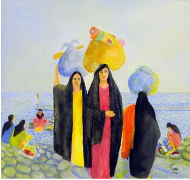
حسين مسيب - الوان مائتة - ٨٠ سم × ١٠٠ سم