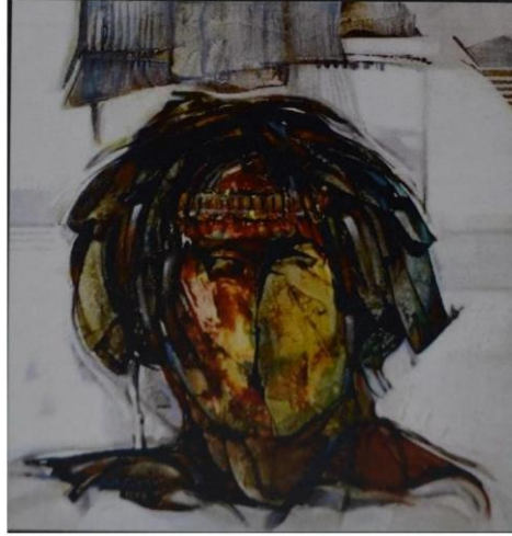
تهامى 60 × 60 سم أكريك على قماش 2012 م

البورتريه واستخدامه ضربات فرشاة متداخلة بطبقات لونية متراكبة العطاء معنى تعبيرى للشكل الإنساني الذي يميل الى التجريد بمعنى التلخيص والتبسيط وكما يتضح من شكل رقم ١٠ للفنانة الليبية نجوى شوكت فيتورى حيث تقدم تجربة متميزة فيها تحريف فالشكل حيث نجد أشكال فتيات متراكبة وفيها استطالة ومتداخلة في بعض الأحيان مع خطوط طولية وعرضية متشابكة مع استخدام ألوان مسكوبة في مسارات معينة داخل اللوحة يعكس فكر الفنانة وتعبيرها الذاتي.