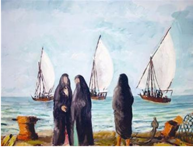
بدر القطامي - الوان مائة ٧٠ سم × ١٠٠ سم .