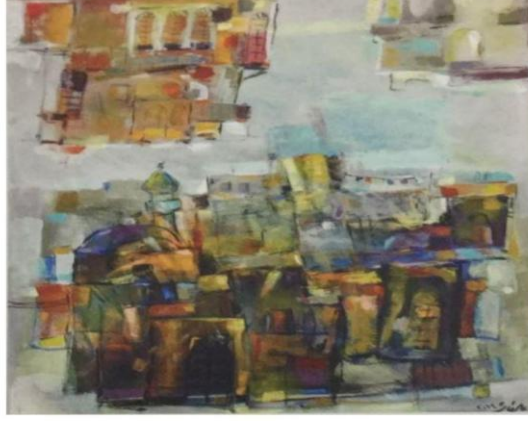
على الطائي أكريك على قماش

حيث كانت الجدد ولأمهات تزيينه وترسم جدران البيوت وترسم الأشكال التراثية وخاصة في منطقة الجنوب وعبر عنها الفنان بأسلوب معاصر وفي ذاته ممارسة التجريب في عملية وتولف الفنان، وتقنياته ذهنية تجمع ما بين فكر وأسلوبه وتراثه الفني (١) .