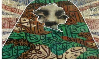
عياد القاضي لغات مختلفة

الشكل رقم ١ للفنان السعودي فهد خليفة وكما يتضح في شكل رقم ٢ للفنان العراقي عياد القاضي حيث يعبر عن مضامين فكرية من خلال الكتابة العربية وتوظيفها بأسلوب معاصر ودمجها مع وجه إنساني وكأنه يطل علينا من التاريخ بشكل فيه عمق من خلال فتحة محدده بخط الخارجي يأخذ شكل وجه امرأه بوضع جانبي فتصبح صورة مزدوجة تحمل رسائل من الماضي مما يوضح أهمية التجريب في الشكل وإمكانية تحقيق الهوية الذاتية لمفنان من خلال التراث في التصوير المعاصر" (١).