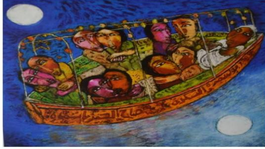
جورج فكري بأسنن على ورق 70 × 70 سم

أدراكه للمتعلقات الجديدة التي تعبر عن خبرة ذات طابع فردى وعميق وتسجيلها بما يضيف الى حضارة الأمم والمجتمعات" (١).