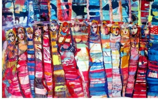
الفنانة الأردنية / نجلا شوكت

الفنان السبيرانية والفن، والليزر والفن (١) ، والتكنولوجيا الحيوية والفن في تقديم رؤى مختلفة لتدخل المشاهد في عوالم جديدة وأفاق جديدة تواكب العصر والعموم الحديثة التي