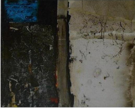
أحمد ماطر عسير من السماء 80 × 120 سم أكريك على قماش وإستخدام الخامات للألوان السينية

كما يتضح ذلك في شكل رقم ٨ لفنان العراقي على الطائي وشكل رقم لفنان الكويتي سامى محمد حيث " يتضح في الأشكال التراثية وتكوينات من البيئة وأشخاص بزي تراثي لكن بطريقة فيها ذاتية تتضح من اختيار اللون وطريقة ترتيب العناصر في العمل الفني، وكما يتضح من خلال الشكل رقم٦ لفنان السعودي احمد ماطر الذى يعبر عن التراث المحلى بأسلوب خاص يعبر عن ثقافته وبيئته ويختزن في ذاكرته أشكال المباني والجدران من الطفولة