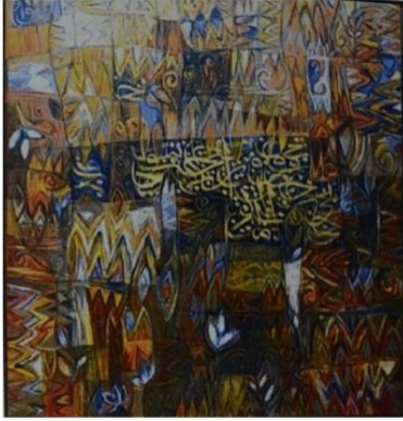
فهد خليفة نقش ورقش 120 × 100 سم أكريلك على قماش 2013

إن دراسة وتحليل المحتوى الفكري والفلسفي للتراث يؤدي الى تفهم الفكرة والمضمون الذي ادى الى ظهور هذا النوع من الفن " التراث وهو نتاج تفاعل الإنسان مع بيئته بفكر وعقيدة المجتمع، ويشتمل علي العادات والتقاليد والقيم وأساليب الحياة السياسية والاجتماعية والاقتصادية لمجتمع ما في زمان ومكان محدد ولذلك يحتوى على كثير من الأفكار والمفاهيم والأساطير الى تؤثر على ظهور