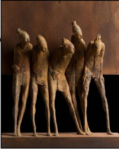
شكل رقم ( ٨ )

تم تطويع امكانيات المعدن في أعمال الفنانة Carol Gold لإحداث النغمة السائدة في العلاقات كذلك استخدام الشمع كوسيط ابداعي بدلاً من الطين كمنحوتات بسيطة هدفها الأول في البحث المستمر عن الأشكال التي تعبر عن الحركة والمزاج باستخدام الشكل التجريدي العضوي كعنصر أساسي التي كانت تتسم دوماً بالبساطة في التعبير عن جوهر الحركة بشكل أفضل من خلال قوام وموقف الشخصيات التي تسعى جاهدة لنقل مشاعرها في راحة هادئة لسطوح الشخصيات المعدنية حول الطبيعة والشخصية البشرية (١)