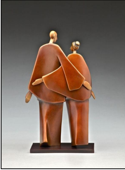
شكل رقم ( ٦ )

من السطوح الملساء من البرونز، كذلك لغة الجسد التي تغطي فيها العاطفة والاحساس بالألفة بدون أي لغة لفظية فيما بينهم مع الشريك أو مع أطفالهم أثناء جلوسهم ، وتم انشاء تلك المجموعات الصغيرة المتناغمة من التماثيل البرونزية حيث يمكنهم الجلوس بحرية علي رف أو حجر طبيعي أو علي البحر في سهولة في الايقاع الشكلي والبنائي كأنك تجلس معهم (١)