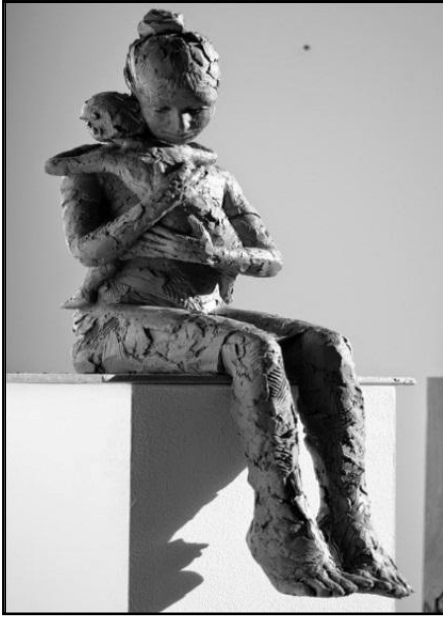
شكل رقم ( ١٠ )

تركزت أعمال الفنان Max Levia في الغالب علي الأشكال الآدمية من المايا الي الفن الاوروبي ومرورا بالفن الافريقي حيث اندمجت كل تلك الثقافات المختلفة في مفردات منحوتاته من انفعالات وحركة متعمقة في الجذور والتي تصل لحد السماء واشتهرت منحوتاته بالحركة الدائمة وكأنه يرسل رسالات واضحة لكافة عناصره التشكيلية من غضب وثورة وحيرة وتلاحم وتزاحم لعناصر المنحوتات بلغة تصويرية للتكوينات النحتية المختلفة (1)