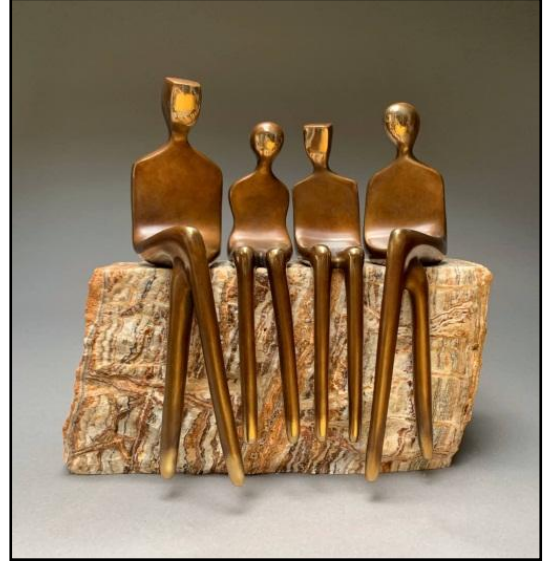
شكل رقم ( ٣ )