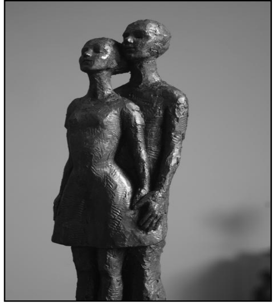
شكل رقم ( ٩ )