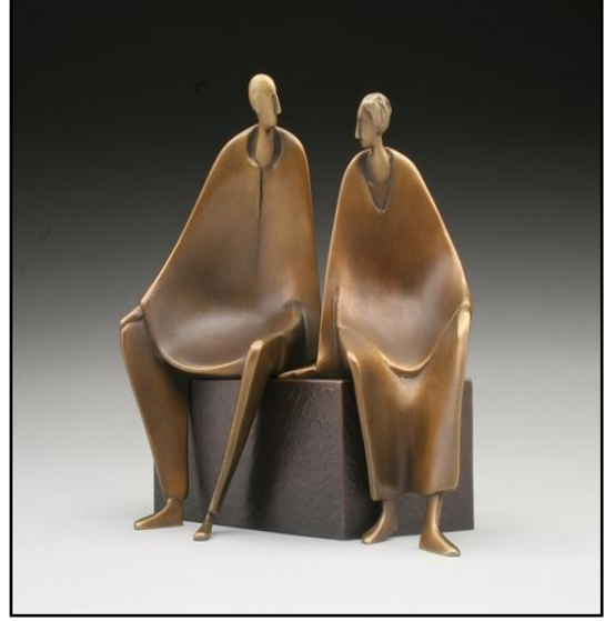
شكل رقم ( ٥ )

Friendship by Carol Gold at Bronze – Coast Gallery ( 1974 )