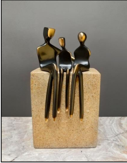
شكل رقم ( ٤ )

حيث يتجمع أفراد العائلة ويلتصق بعضهم ببعض - لفئات من الحنان والحماية . وذلك بتجاهل تفاصيل الوجه والتركيز علي ضخامة اليدين والساعد . بقت الأصابع تحتفظ بتفاصيلها الانسيابية الواضحة ، وبسهولة نقرأ العلاقة الحميمة التي تربط مجموعة التماثيل ، من حركة التفات بسيطة ليد موضوعة علي الكتف او تماس ركبة الأشخاص أو ميلان رأس أو حتي استمرارية غطاء القماش الذي يبدو وكأنه قطعة واحدة غير مفصولة يشترك فيها الأب والأم (١)