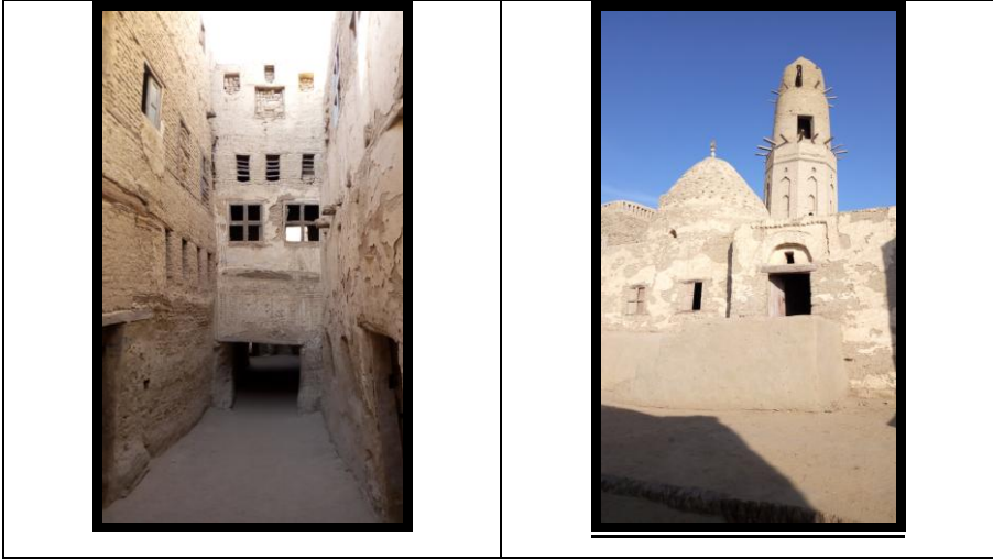
شكل رقم (١٤) يوضح اجزاء من مدينة القصر الاسلامية

ومن خلال الزيارة الميدانية التي قام بها الباحث و اللوحة التعريفية لمدينة القصر الاثرية الاسلامية نجد أنها نموذج فريد للمدن الإسلامية المتكاملة ومن أهم المدن الاثرية الباقية من عدة دروب صحراوية كانت تستخدم قديما القوافل التجارية وترجع المدينة الى القرن العاشر الهجري وامتدت حتى العصر العثماني عمارة المدينة في هي عبارة عن مدينة متكاملة مكونة من عدة دروب وحارات و سميت بأسماء قاطنيها مثل حارة الجزارين والحبانية والقرشيين وتخللها المنازل التي بنيت بالطوب اللبن مكونه من طابقين أو ثلاثة بأسقف من افلاق النخيل التي يصل بينهما الجريد المتراص و مغطاة بالملاط طيني كما يوجد بها العمائر الخدميه مثل العصاتر والطواحين بالإضافة إلى المساجد والأضرحة.