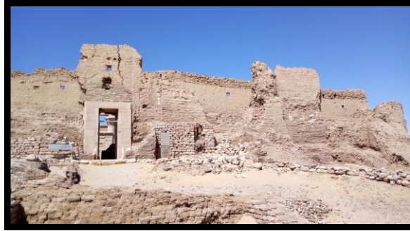
شكل رقم (٦) يوضح واجهة قصر الغويطة

ما يسعى إليه الباحث هو استفاده من الصياغة التشكيلية أجزاء المعبد ودراسة هذه الأجزاء وتحليلها للوقوف على أهم سماتها الفنية واستخلاص القيم الفنية الموجودة بها والاستفادة منها.