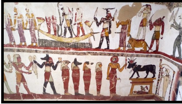
شكل رقم (١٢) يوضح الشكل بعض رسومات احدي مقابر المزوقة (تصوير الباحث)