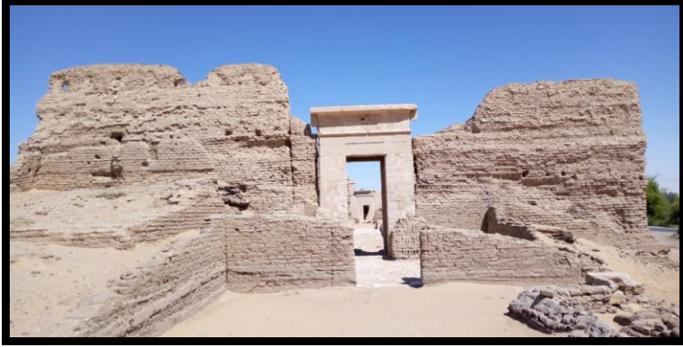
شكل رقم (٨) يوضح واجهة معبد قصر الزيان