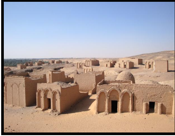
شكل رقم (١٣) يوضح بعض مزارات البجوات

للجوات طراز معماري مميز وذلك بسبب طراز الاسقف المعماري الفريد على شكل القبوات والاعمده والعقود الموجوده بها وطرازها المعماري بيزنطي و يرجح انها من القرن الخامس الميلادي (١) .