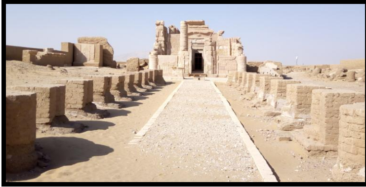
شكل رقم (١٠) يوضح الاجزاء الامامية للمعبد (تصوير الباحث)