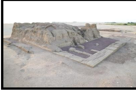
شكل رقم (٣) يوضح مصطبة خنتكاببي (٢)

ويرى الباحث أن هذه المنطقة الاثرية من اهم الاثار الموجودة في واحات الوادي الجديد وذلك لأهميتها التاريخية حيث يرجع تاريخها إلى الدولة الفرعونية القديمة.