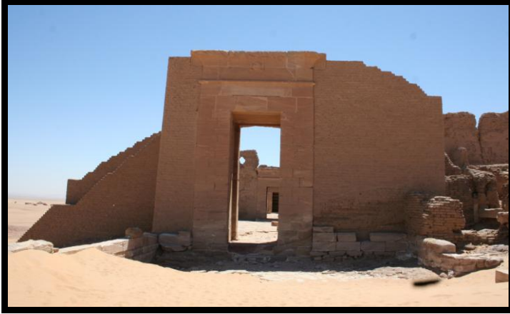
شكل رقم (٩) يوضح واجهه معبد دوش

ترجع الأهمية الأثرية إلى هذه المنطقة حيث "تضم قلعة من الطوب اللبن ترجع للعصر الروماني داخل أسوارها معبد حجرياً" (١) ، وتذكر أحد المراجع انه "يرجع تاريخ بداية انشاء معبد دوش الحالي إلى اوائل القرن الثاني الميلادي وبالتحديد في عصر الإمبراطور الروماني (تراجان عام ١١٧م) وذلك طبقاً لنص التكريس الموجود على العتبة العلوية للبوابة الأولى للمعبد بالجانب الشمالي تحت حكم (ماركوس روفيلوس لوبوس) حاكم مصر أيام هذا العصر حيث كورس المعبد لعبادة المعبودين (سراييس وايسة وابنها حور)" (٢) .