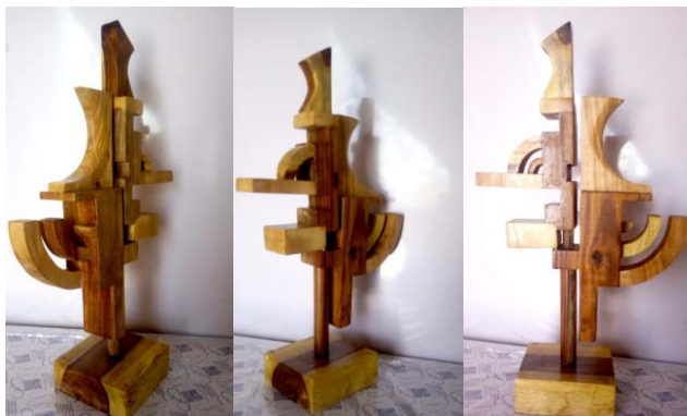
شكل رقم (١٤) التطبيق الذاتي للباحث

إجراء التطبيق الذاتي للباحث والذي يظهر كيفية الاستفادة من دراسة وتحليل واستيعاب الهينات الشكلية والعلاقات التشكيلية لعناصر العمارة الاثرية بالوادي الجديد في استحداث مشغولات خشبية .