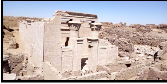
شكل رقم (٧) يوضح مبني المعبد داخل قصر الغويطة