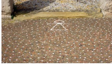
شكل رقم (٢) علامة أو رمز التانيت رقيقة (بعل) ١

"سعى الفنان الشعبي التونسي في معظم اعماله و منتجاته التقليدية المعيشية الى تعدد العناصر الزخرفية النباتية باشكالها و تنوعاتها و كذلك العناصر الهندسية و اصبحت مقومات اساسية في بناء هذا الفن و يتضح فيها مدى التنوع الزخرفي والتشكيلي من خلال بعض الزخارف المستخلصة من اعمال السيراميك والنسيج و الزخارف والحلي والجص و قد انتشرت هذه الزخرفة في مجالات مختلفة في تزيين القباب والتحف المختلفة النحاسية والزجاجية." (٢)