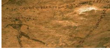
شكل رقم (١٦) (١) (حروف التيفناغ بصخور مدينه طاطا بالمغرب )

وأرتبط إرتداء الحلى المغربية بالقوة السحرية وتحددت المواد والألوان والأشكال والزخارف نوع هذه القوى وتستخدم الحلى كتمايم في جميع انحاء العالم الإسلامى والتمايم غالبا ماتكون اسطوانية او مربعة الشكل وتحتوي على آيات من القرآن مصفوفات سحرية او دعاء للحماية من الحسد او جلب البركة ومن امثلة التمايم الخميسة او كف فاطمة وهى تشير الى اركان الإسلام الخميسة وتدل على استسلام الأنسان لادارة الله وحمايته (٢)