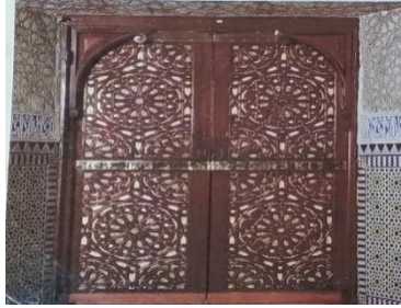
شكل رقم (٣٠) ( باب خشبي منحوت من المغرب ) (٢)

الأبواب الخشبية : باب خشبي منحوت ومجمع ومطعم بالعظم . مما يعطي إنطباعاً شاملاً بالغ التفرد . وتتباين زخارف النجوم الاثنا عشر المنفذه بالخشب المضلع مع التطعيم الذي حرقت بعض أجزائه وكأنها وشمت بالمدفع علي هيئة توريق أنجوم صغيرة وهو مثال للزخارف المغربية النباتية والهندسية (١)