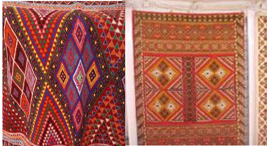
شكل رقم (٣١، ٣٢) (*زرايبية قيروانية و *المرقوم بهما زخارف هندسية من تونس) (٤)

الزرايبية القيروانية وهي نسيج من الصوف أو الحرير المميز وتتكون من اشربة متوازية تتوزع علي مساحة الزرايبية و سطحها زخارف زهرية او هندسية تتوسطها مساحة مستطيلة وهذه الزرايبية والمرقوم يظهر علي سطحها زخارف هندسية والوان زاهية ومبهجة واشكال مثلثة وهرميه ومستطلات ومعينات وسيادة اللون الاحمر يدل علي القوة والآثارة (٣)