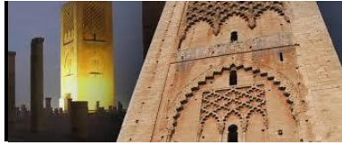
شكل(٣)٤ (منارة حسان ،الرباط ، بالمغرب )

مثال الزخرفة المغربية منارة او الصومعة مسجد حسان من المباني التاريخية المتميزة بالعاصمة المغربية الرباط، والتي شيدت في عصر دولة الموحدين. تم تأسيس «جامع حسان» بناءً على أمر يعقوب المنصور سنة ٥٩٣ هـ (١١٩٧-١١٩٨ م) يأخذ الجامع شكله العام من هندسة الجوامع الأندلسية، ، ومن مؤثرات القيروان عقود المنار المتجاوزة، وكذلك عدم تساوي الأعمدة ولو أنها كانت عن قصد في *جامع حسان (٣)