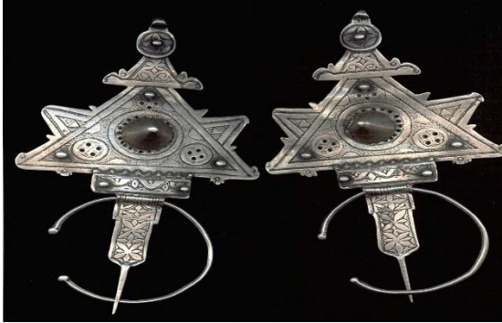
شكل رقم (٢٩) ( الخلال من الحلي المغربية والتونسية ) (٣)

الخلال : تعتبر من أشهر مصنفات الحلي المغرب العربي وأكثرها استخداما خاصة بين نساء (تونس والمغرب ) ولقد اعتادت المرأة ارتداء الخلال في حياتها اليومية كما صنعت بعض الخلال خصيصا للمناسبات وهي عادة تستخدم كاحجية يعتقد في قدرتها علي درء الحسد والحماية من الأرواح الشريرة وغالبا ماتكون زوج متماثل تثبت علي الصدر في الملابس وهي علي هيئة مثلث يظهر علي سطحه زخارف نباتية وهندسية وتثبت في الملابس عن طريق دائرة يتوسطها دبوس (٢)