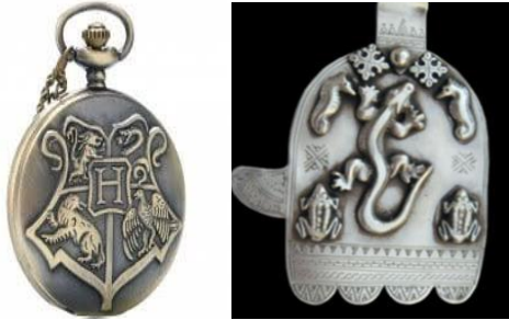
شكلى رقم (٨،٧) (٤) (دلالية تمثل عناصر حيوانية )

الحيوانات البرية-الثعبان (يرمز للخصوبة)-السحالي (زيادة الانجاب)-الاسماك (ترمز الى الخير و الاخصاب)-الطيور (ترمز للسلام) (٣)