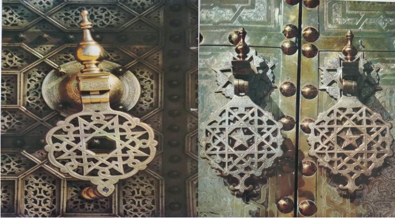
شكل ( ٢٦،٢٧ ) (٢)

تحلي بنجمة مئمنة طراقة الباب المصنوعة بالصب وتكرر النجمة كذلك في المكان تثبيت النجمة المئمنة تري النجمة الشريفة الخماسية ، وتظهر هذه النجمة الخماسية أيضاً علي مسامير العوارض وطبقاتالتقاليد الفنية المغربية .تستطيع زخرفة النحاس أيضاً الجمع بين الزينة والفن (١)