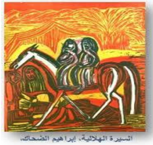
حفر علي خشب، تونس

يعزى إليه الفضل في تركيز صفحات كبرى داخل ملف الحفر الفني بتونس، إذ هو أول فنان تونسي واطب على ممارسة هذا النوع الفني في تجربته الإبداعية. وتبدو الروح الفلكلورية عند الضحاك في رسومه متضمنة مختلف مظاهر الحياة التقليدية و المحلية، وهو إزاء ذلك يقوم بإيجاد توازن بين تجليات تقنية تشكيلية متاصلها وبين حس مرهف بالقيم التراثية التي يزرخ بها محيطها والخاصة أنه شكل من خلال ممارسته التشكيلية المتواصلة أحد ثوابت الفن التشكيلي التونسي المعاصر خاصة في باب "الحفر" و من خلال كتبه الفنية ذات المساحات الكبيرة الشكل (٢٢) (١) توصيف العمل الفني :