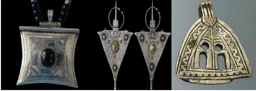
شكل رقم (٤) (الخط) شكل رقم (٥) (المربع) شكل رقم (٦) (المثلث) (٢)

الخط (خط مستقيم يرمز الى الخير-خط افقى يرمز الى الشر-خط مائل يرمز الى فروع الاشجار)-المربع (يرمز الى الاتجاهات الاربعة)-الدائرة (قرص الشمس)-المثلث (يرمز الى السماء و الارض)-المعين (يرمز الى العين)-المستطيل (يرمز الى الارض)-المجسمات (ترمز الى العين و قرون الحيوانات) (١) مثال