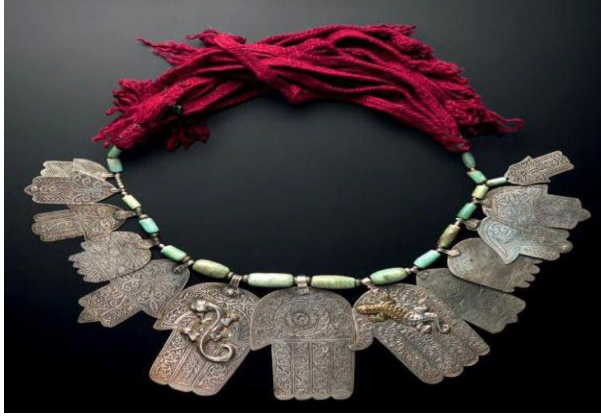
شكل رقم (٢٨) الخمسية (تميمة علي شكل عقد) (١)

الخلال : تعتبر من أشهر مصنفات الحلي المغرب العربي وأكثرها استخداما خاصة بين نساء (تونس والمغرب ) ولقد اعتادت المرأة ارتداء الخلال في حياتها اليومية كما صنعت بعض الخلال خصيصا للمناسبات وهي عادة تستخدم كاحجية يعتقد في قدرتها علي درء الحسد والحماية من الأرواح الشريرة وغالبا ماتكون زوج متماثل تثبت علي الصدر في الملابس وهي علي هيئة مثلث يظهر علي سطحه زخارف نباتية وهندسية وتثبت في الملابس عن طريق دائرة يتوسطها دبوس (٢)