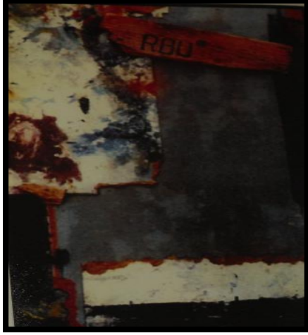
شكل (٦)، منير كنعان، معلقة حائطية ذات مستويات متعددة، ١٩٦٠

ثالثاً: شرح وتحليل لبعض أعمال الفنانين اللذين استخدموا خامات مختلفة داخل أعمالهم الفنية بشكل عام والمعلقات الطباعية بكل خاص.