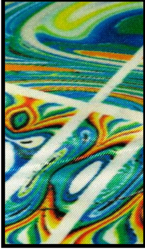
شكل (٣) تطبيقات ذاتية للباحثة، تشكيل الورق الحراري المجهز بالكمبيوتر بالقص ثم طباعة على قماش ستان.

يمكن طباعة التصميم بعد عمل تشكيلات مختلفة في الورق ذاته بتأثيرات مثل الطي، الكرمشة والتطبيق ونقلها حرارياً فوق السطح فينتج عنها تصميمات مختلفة باختلاف طرق الطي ، كذلك يمكن تفريغ وقص تشكيلات مختلفة من الورق قبل طباعته علي السطح لتشكيل هيئة الوحدة المطبوعة ويتم التفريغ والقص بواسطة عدة طرق: