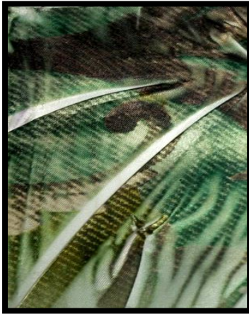
شكل (١) تطبيقات ذاتية للباحثة، تشكيل السطح(قماش الستان) بالطي ثم الطباعة عليه بأوراق النقل الحراري جاهزة الصنع.

يتم من خلال إحداث تشكيلات مختلفة بالسطح الطباعي ذاته قبل طباعة التصميم فوقه باستخدام العديد من التقنيات والطرق كالسراجة ، الطي، الكرمشة، التطبيق المنتظم وغير المنتظم ... وغيرها من اساليب التشكيل لعمل عزل جزئي بالسطح لمنع إنتقال الصبغات إلي الأجزاء المطوية نتيجة تلك التقنيات محققة تأثيرات سطحية مميزة، مثال ذلك شكل (١).