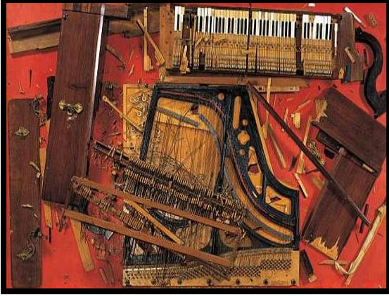
شكل (٧)، فرناديز ارمان F.arman، معلقة، حائطية، استخدم بها حطام بيانو، ١٩٨٢، عادل ثروت، مرجع سبق ذكره، ص ١٠٠

ثانياً : الأسس التشكيلية والجمالية في بناء العمل الفني