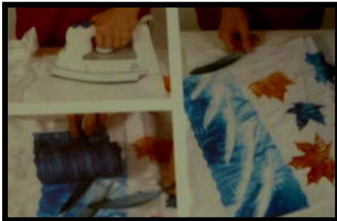
شكل (٢) يوضح تأثير مانع الريش على سطح القماش ، Kate Wells: " Fabric Dying and Printing" – conran octopus limited –octopus publishing Group, London Printed in China- 2000.p 110

والخامات ذات التأثيرات الملسية المختلفة التي تعمل كعازل يحجب إنتقال الصبغات الي الأماكن المغطاه بتلك الخامات أثناء عملية الأنتقال الحراري الي السطح تاركه أماكن