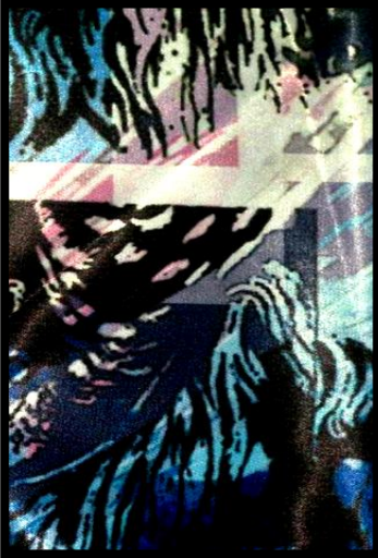
شكل (٤) تطبيقات ذاتية للباحثة، ورق حراري مجهز بالكمبيوتر مطبوع على قماش ستان يوضح الشفافية .

إن أكثر ما يميز الألوان المطبوعة بطريقة النقل الحراري هي الشفافية مما يتيح إمكانية تراكم الطبقات للحصول علي صور جمالية متعددة.