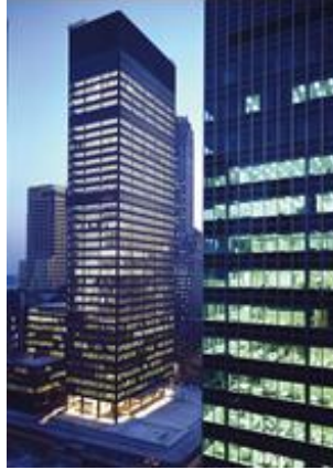
شكل رقم (٣) يوضح

ضمت عمارة الحدائثة - في تصنيف "Jencks" - الإتجاهات المعمارية الحدائثة احادية التوجه، والذي تمثل اما في تطبيق اقصى التكنولوجيات المتاحة كما في الإتجاهات المعمارية العقلانية، او في العودة الحنينية إلى الماضي والفن كما في الاتجاهات المعمارية العاطفية. "واطلق "Jencks" على هذه الاتجاهات اسم "العمارة ذات الشفرة الاحادية "Single-Coded Architecture"، حيث تعاملت هذه العمارة مع الانسان الاحادي المجرد، واهملت تأثير الزمان والمكان، وحمل نتائجها المعماري صمماً للنخبة والعامّة. وظهرت الاتجاهات المعمارية الحدائثة وبلغت نجاحها في الفترة ما بين (١٩٢٠-١٩٦٠م). وصنف "Jencks" عمارة الحدائثة الى مجموعتين فرعيتين متوازيتين هما: الاتجاهات العقلانية والاتجاهات العاطفية، اعتماداً على الشكل الذي تأخذه هذه الشفرة الأحادية" (١) . كما هو موضح بالشكل رقم (٣)