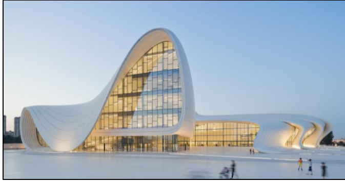
يوضح شكل رقم (٤) مركز حيدر علييف بجمهورية أذربيجان (١)