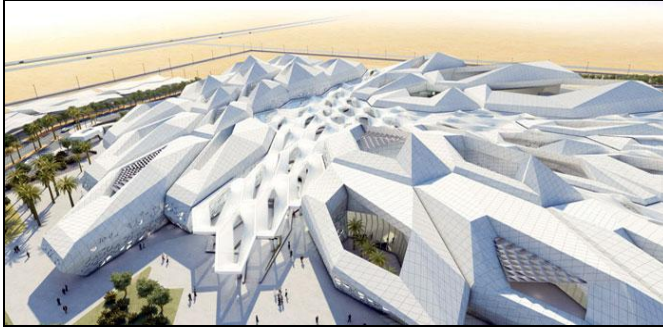
يوضح الشكل رقم (٥) مركز الملك عبد الله للدراسات والأبحاث البترولية بمدينة الرياض (٢)