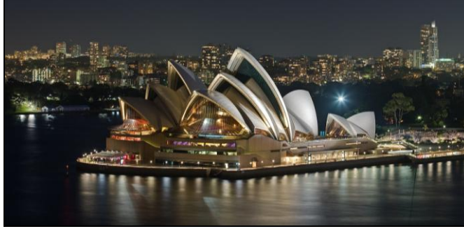
شكل رقم (٦) يوضح اوپرا سيدني باستراليا (٣)