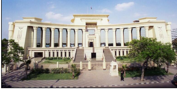
شكل رقم (١) يوضح المحكمة الدستورية العليا بالقاهرة (٢)

هذه العمارة شعار (الشكل يتبع الوظيفة) فاصبح قانونا لها. وفي الستينيات ظهر اتجاه عمارة ما بعد الحداثة، وتقدم عدد من المعماريين ينادون بعمارة ما بعد الحداثة وبذلك اهتم رواد هذا الاتجاه بالتاريخ والموروث الحضاري، والتأكيد علي العودة الي القواعد الكلاسيكية واعادة قراءة الاشكال القديمة، وذلك في قالب حدائي مبتكر يستمد جذورة من الماضي ويتسق مع طبيعة وتقنيات العصر الحديث (١) كما هو موضح بالشكل رقم (١).