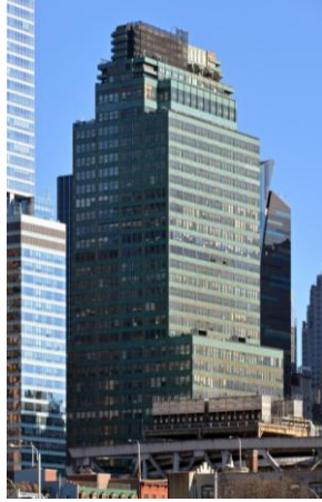
شكل رقم (٢) يوضح

صنف "Udo Kultermann" (١) عمارة القرن العشرين الى اربع مجموعات رئيسية متتالية من الاتجاهات المعمارية، " تقع كل منها داخل مدى زمني محدد، واعتمد المصنف على رصد توجهات العمارة والمهام التي تؤديها لخدمة المجتمع، ليكون اختلاف هذه التوجهات أساساً للتصنيف، ويرى "Kultermann" ان توجهات العمارة في الفترة ما بين (١٩١٠- الي ما بعد ١٩٧٠) قد اصابته اربعة اهداف متتالية، هي: التعبير النقبي عن عصر التكنولوجيا، التخلص من سيطرة الالة، حل مشكلات ما بعد الحرب بالامكانات التي اتاحتها الحرب، واخيراً ارتباط العمارة بالمجتمع وتعبيرها عن الهوية المحلية". (٢) كما هو موضح بالشكل رقم (٢).