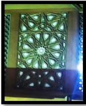
(د) مسجد الرفاعي

الطريقة الثانية: يطلق علي هذا الأسلوب اسم التطعيم الحقيقي تتم عن طريق تحضير سطح المشغولة الفنية المراد تطعيمها من خلال الحفر والنحت والبرد، ثم تحديد المساحات التي سوف يتم فيها عملية تعشيق قطع الصدف بينها وتكون فيه خامات التعشيق اعلي قيمة من السطح المضافة الية مثل العاج، المعادن والاحجار الكريمة تتم بأسلوب متناسب مع المساحة المحيطة للقطع الفنية، وهذا الأسلوب شديد الدقة منتشر بسوريا كما في شكل (٢ ج، د).