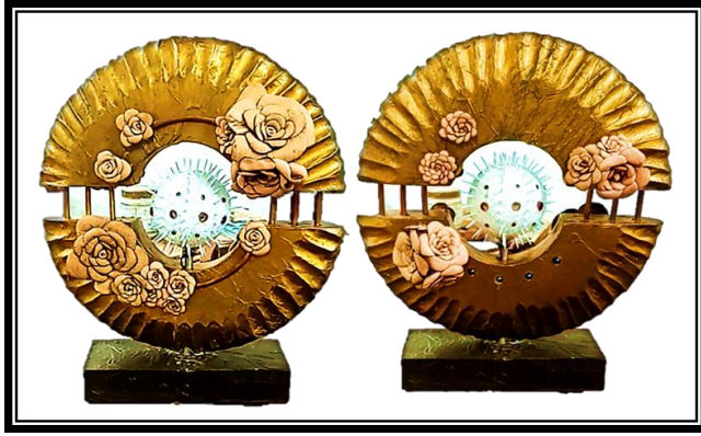
التجربة الذاتية للباحثة شكل (٧)

احدي الجهات، وتغطية السطح بوحدات من الورد مختلفة الحجم المنفذ بخامة الجلد الطبيعي، كما نجد دائرة متوسطة الحجم في منتصف العمل منقذه من الصوف الزجاجي، تمت فيها عملية التعشيق بمواسير النحاس مختلفة في القطر، واعواد الخشب الطبيعي، كما استفادت الباحثة من تكنولوجيا الضوء والفرن الحركي في مرحلة ما بعد الحدائة والذي ظهر في الدائرة حيث تتحرك علي موتور كهربائي، الي جانب ضوء الليد المثبت في داخلها والذي يلقي بظلاله علي الاطار الداخلي للدائرة الرئيسية مما يمنح العمل قدرا من الاتزان والتنوع.